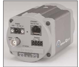
IQeye 700/750 back panel

Jede IQeye gibt Ihnen die Möglichkeit, die Bilder bereits in der Kamera zu schützen – mit der digitalen IQauthenticate™ wird jedes erfasste Bild digital signiert, um sicher zu stellen, dass die Bilder nachträglich nicht manipuliert werden können.